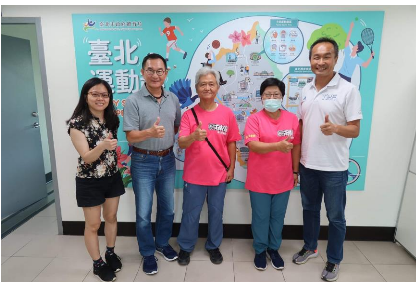
台北市政府體育局