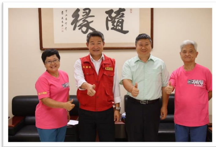
高雄市政府消防局