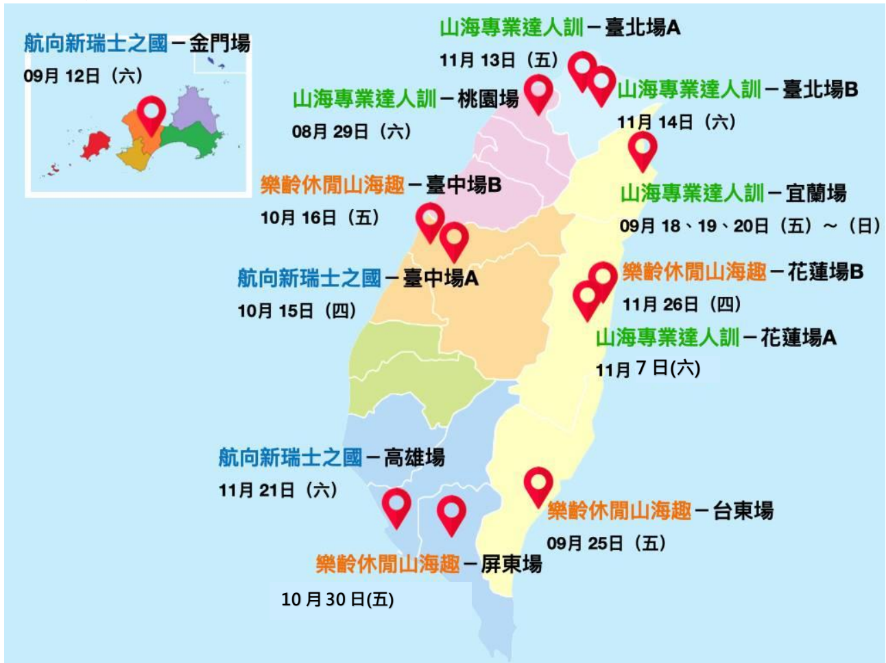
<2020 面山面海教育與安全機制論壇場次安排>