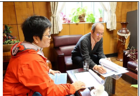
農業委員會林業試驗所